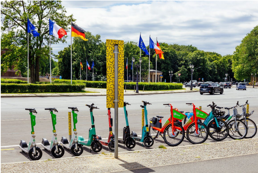
Mit Jelbi zum Feiern. Ein neuer Jelbi-Punkt in Tiergarten

Rund um die Feierzone wurden und werden bis zum Anpfiff außerdem zahlreiche Standorte für die Leihfahrzeuge der BVG-Mobilitätsplattform Jelbi geschaffen. Fans – natürlich nur nüchterne – finden dort das passende Gefährt, vor allem Sharing-Bikes und E-Tretroller, um zum nächsten Bahnhof (oder weiter) zu kommen. Insgesamt 13 Jelbi-Punkte gibt es in Kürze im Bereich Tiergarten zwischen Brandenburger Tor und Großem Stern. Rund die Hälfte ist schon eingerichtet. Im gesamten Bezirk Mitte sind es dann über 100 Jelbi-Standorte. Rund um die Fanmeile ist die Jelbi-Fußpatrouille der Sharing-Anbieter unterwegs, um für ein ordentliches Abstellen der Fahrzeuge zu sorgen.